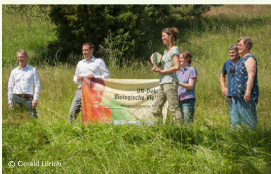
LANDSCHAFT ANPACKEN erhielt 2021 die Auszeichnung als Projekt der UN-Dekade Biologische Vielfalt