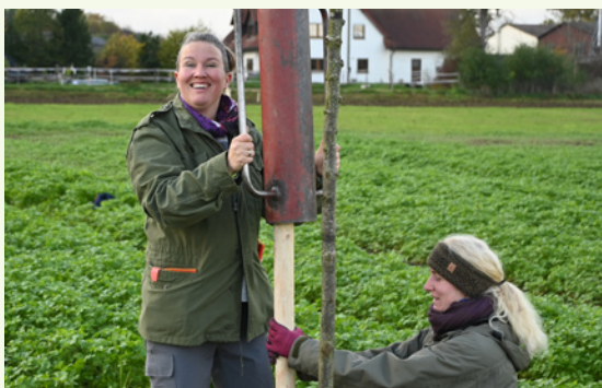
Für Pflanzungen braucht es Sachverstand

Hier können sich Einsatzmöglichkeiten für die Teilnehmerinnen und Teilnehmer der Weiterbildung ergeben.