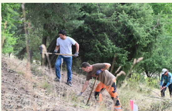
Landschaftspflege auf den Weideflächen des Schäfers