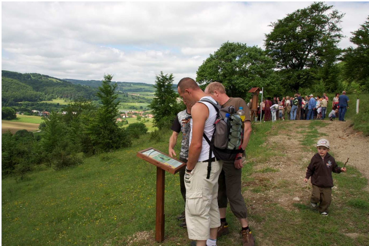
Abbildung 159: KG3 (Fischbach, 2010) Artensteckbriefe am Hexenpfad, Einweihung des Naturerlebnispfades zum 3. Projektfest