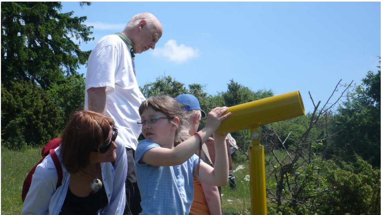
Abbildung 157: KG6 (Oberkatz, 2008) Sehrohre am Schäferweg, Einweihung des Naturerlebnispfades zum 2. Projektfest