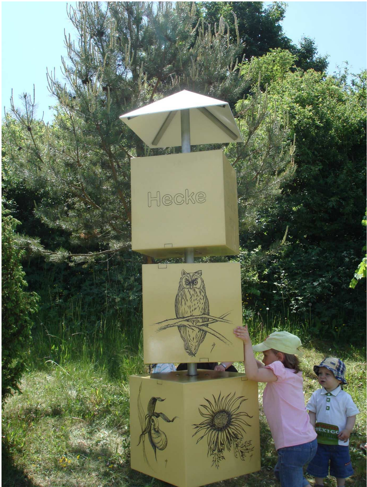
Abbildung 155: KG6 (Oberkatz, 2008) Drehwürfel am Schäferweg, Einweihung des Naturerlebnispfades zum 2. Projektfest