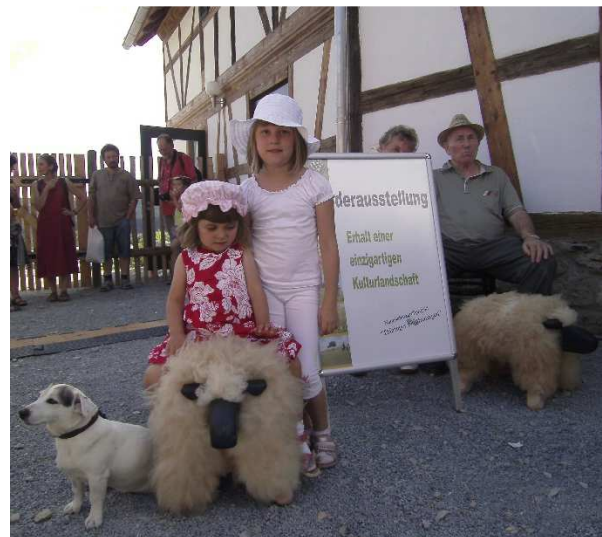
Abbildung 166: KG3 (2012) Wanderausstellung `Erhalt einer einzigartigen Kulturlandschaft` anlässlich eines Dorffestes in Wiesenthal und beim Schäfertag in Hohenfelden