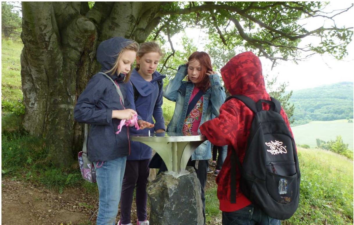
Abbildung 164: KG3 (Fischbach, 2013) Station `Panoramatafel` am Hexenpfad, Langer Tag der Natur