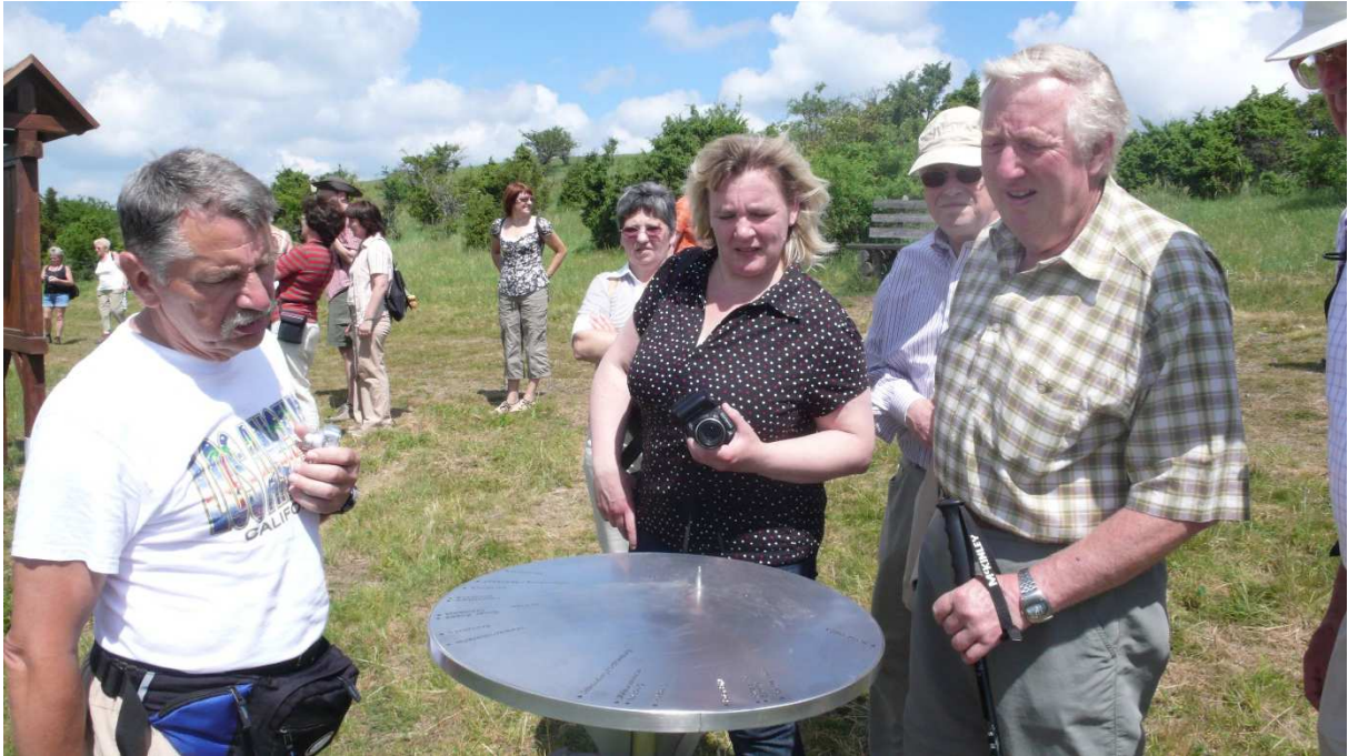
Abbildung 156: KG6 (Oberkatz, 2008) Panoramastation am Schäferweg, Einweihung des Naturerlebnispfades zum 2. Projektfest