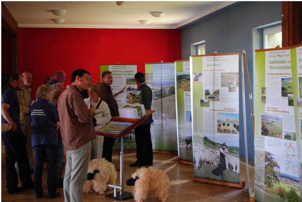
Abbildung 165: KG3 (Hohe Geba, 2012) Einweihung der Wanderausstellung `Erhalt einer einzigartigen Kulturlandschaft` zum 4. Projektfest