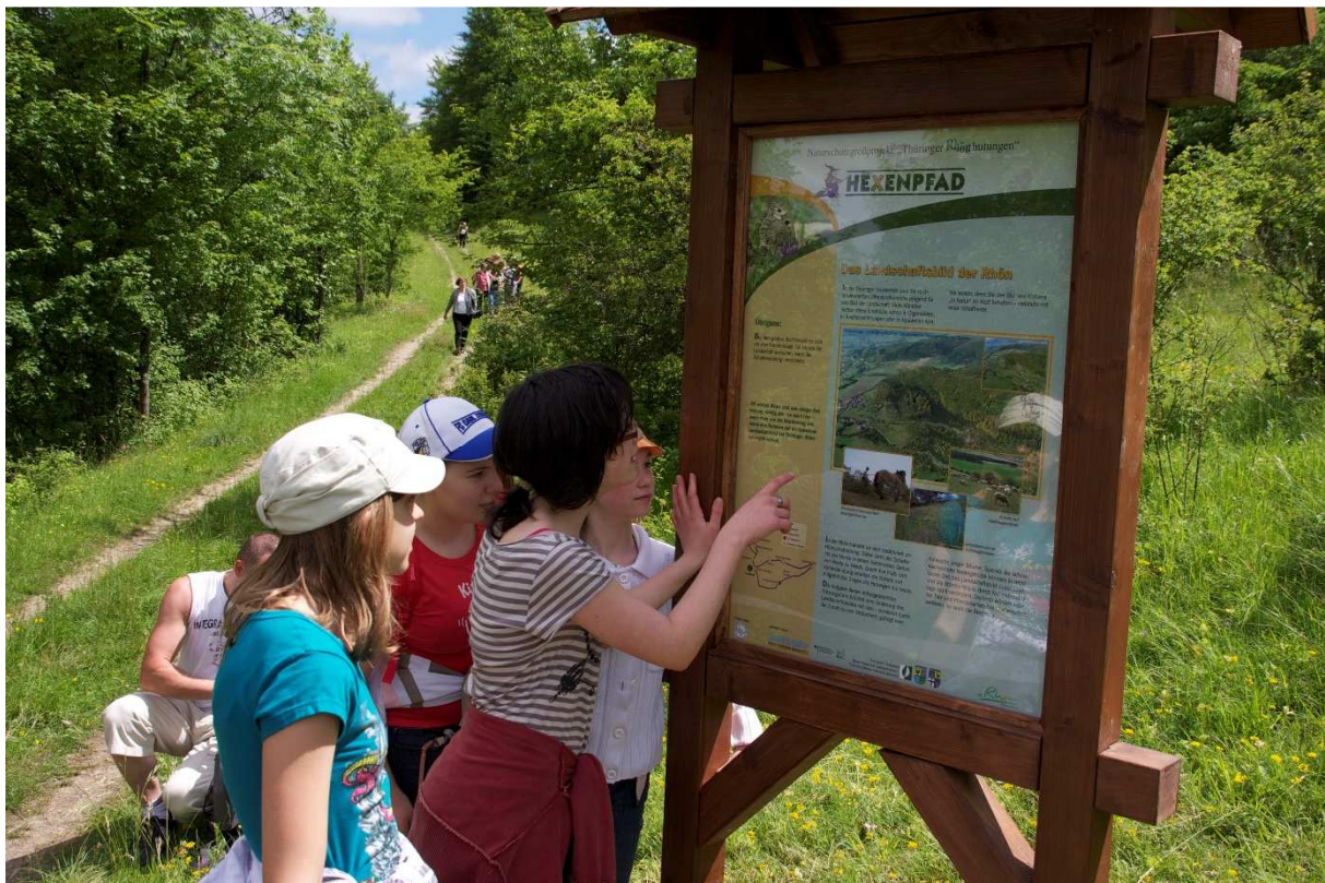
Abbildung 160: KG3 (Fischbach, 2010) Station 'Landschaftsbild' am Hexenpfad, Einweihung des Naturerlebnispfades zum 3. Projektfest