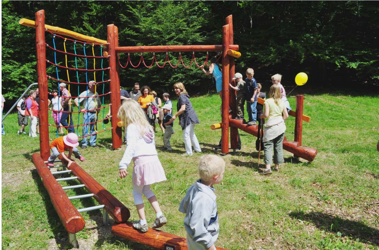
Abbildung 161: KG3 (Fischbach, 2010) Station `vernetzte Landschaft` am Hexenpfad, Einweihung des Naturerlebnispfades zum 3. Projektfest