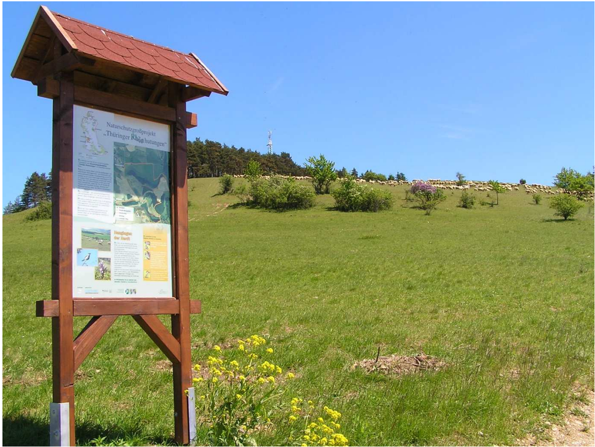
Abbildung 154: KG5 (Kaltennordheim, 2010) Beispiel einer Besucherlenkungstafel