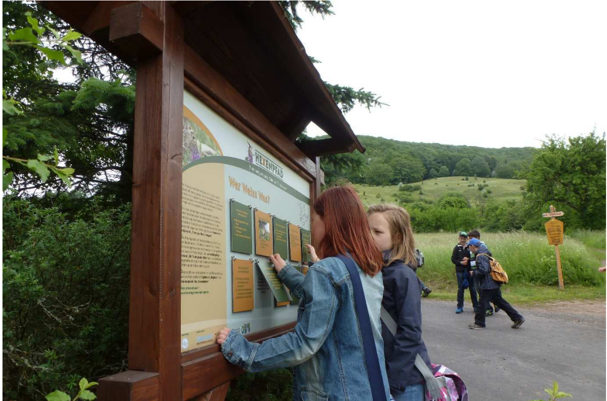
Abbildung 163: KG3 (Fischbach, 2013) Station `Quiztafel` am Hexenpfad, Langer Tag der Natur