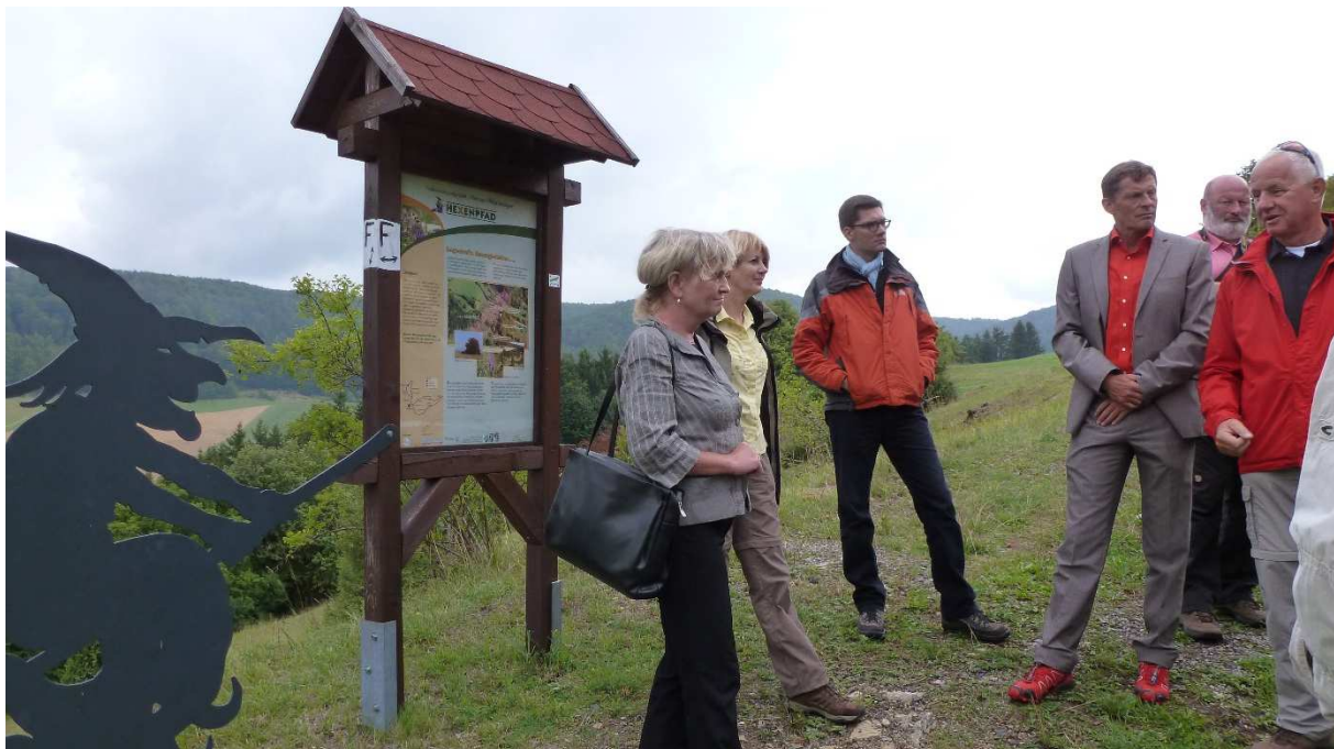
Abbildung 162: KG3 (Fischbach, 2013) Station `Hutebuchen` am Hexenpfad, Sommerreise Prof. Beate Jessel