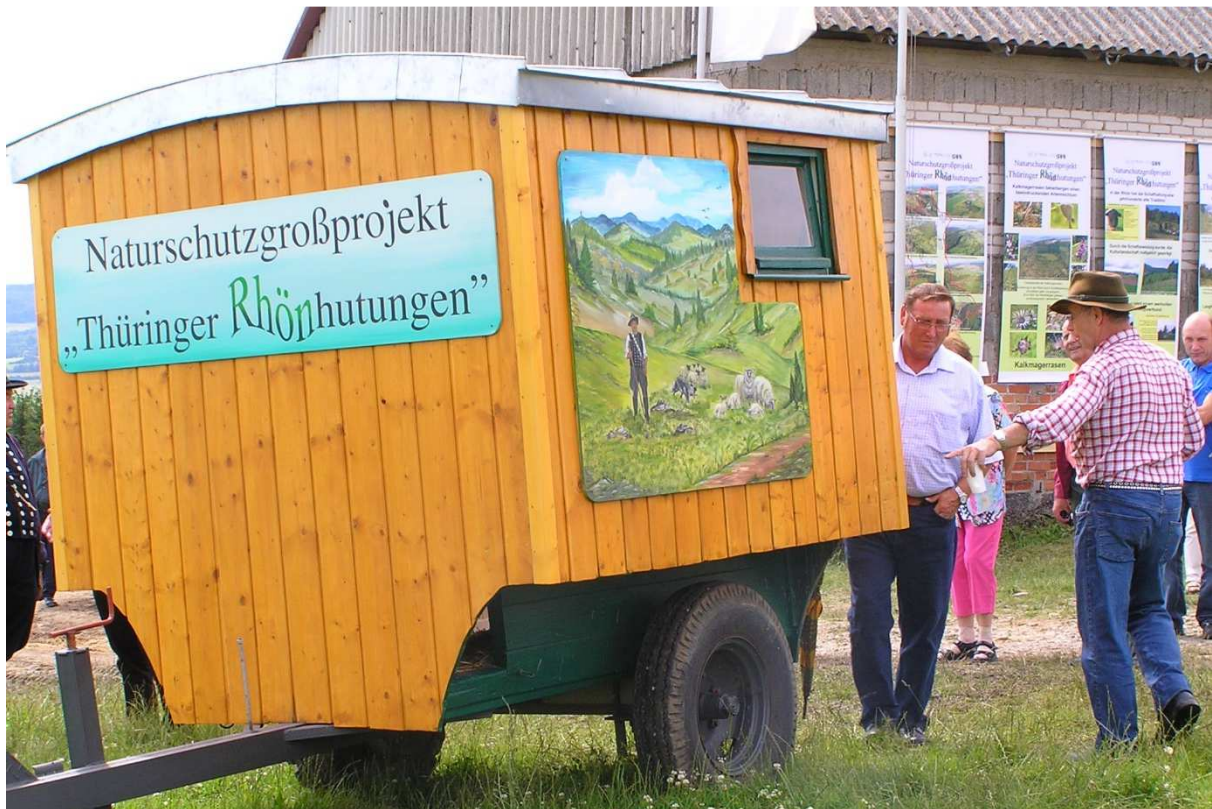
Abbildung 152: KG5 (Kaltensundheim, 2007) Einweihung eines restaurierten Schäferwagens beim 1. Projektfest