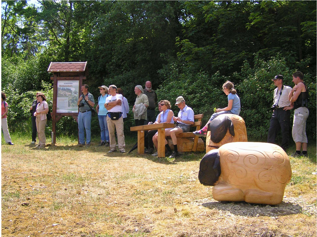
Abbildung 158: KG6 (Oberkatz, 2008) Kletterschafe am Schäferweg, Einweihung des Naturerlebnispfades zum 2. Projektfest